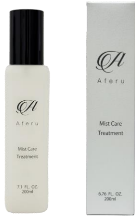
アフエル ミストケア