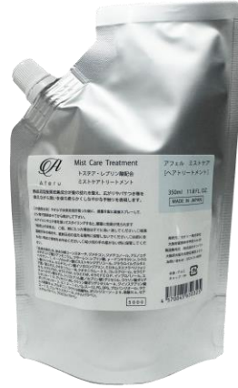
アフエル ミストケア